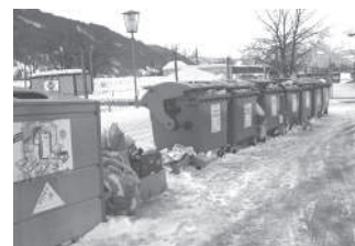
Im Bild oben und links: Eine verunreinigte Sammelstelle

Wir weisen noch einmal darauf hin, dass dieses Fehlverhalten kein Kavaliersdelikt darstellt und nach den Bestimmungen des Abfallwirtschaftsgesetzes verfolgt und geahndet wird.